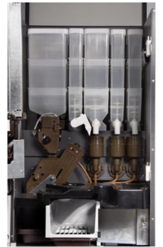
Détail batteurs G250 Wippers and beam to cup brewer.