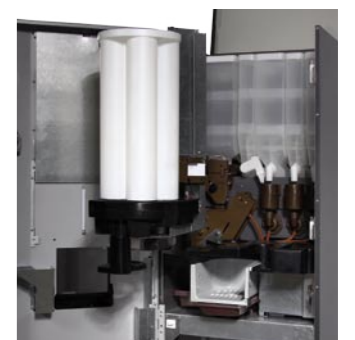
Une capacité pour 500 gobelets Capacity for 250 drinks