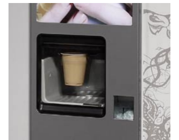
Fenêtre de récupération Product collection outlet